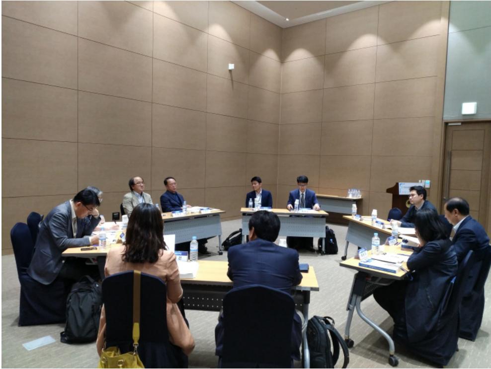
[그림 3-3] 한국도시행정학회 학술대회/포럼 사례