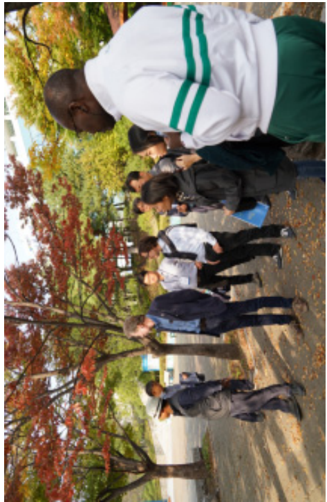
[그림 2-8] 일산동구청 일대 팀방 사진