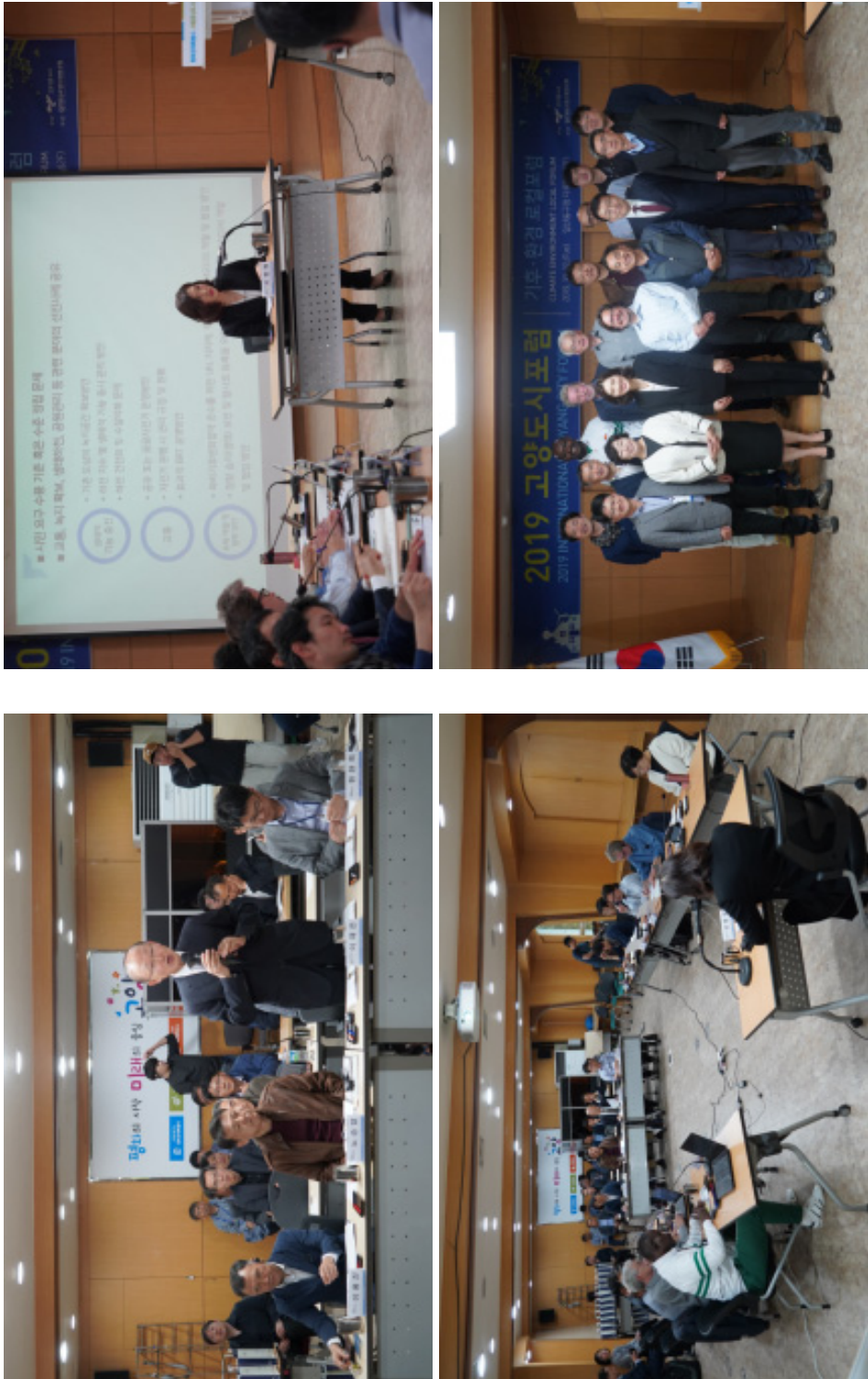
[그림 2-9] 로컬포럼 사진