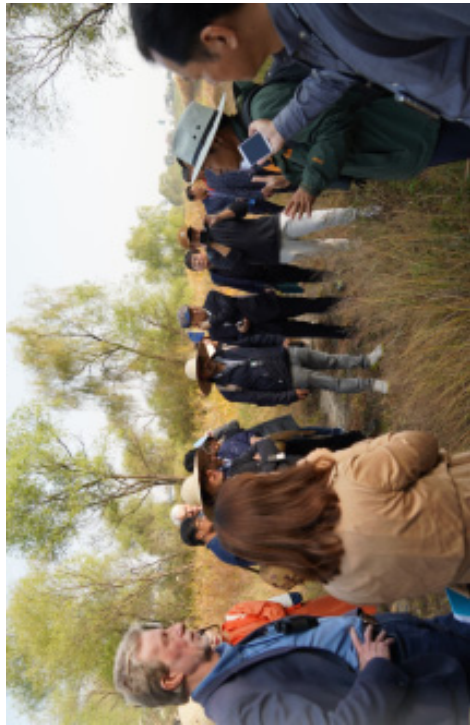
[그림 2-4] 정항습지 탐방 사진