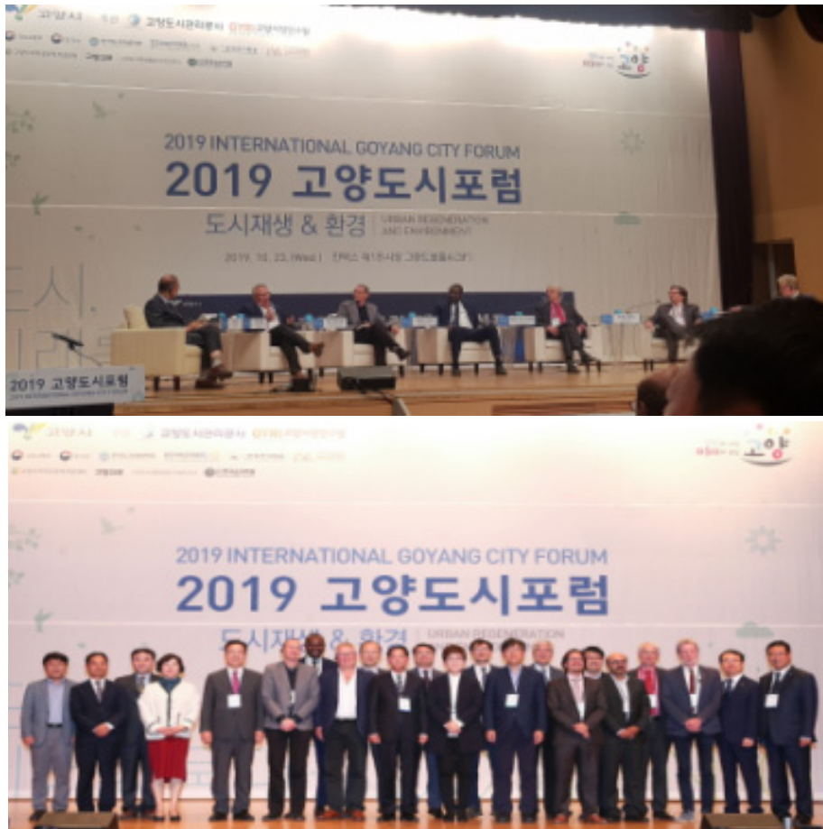
[그림 1-2] 2019년 고양 도시포럼 개최