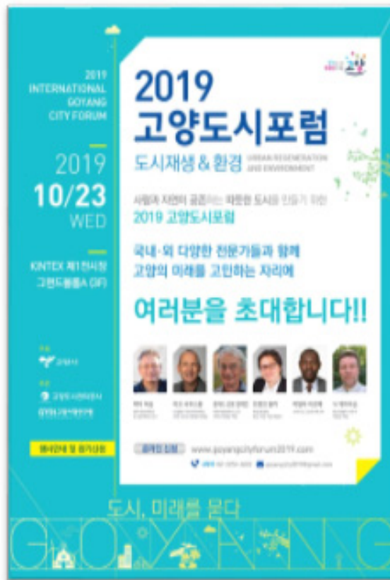
[그림 1-1] 2019년 고양 도시포럼 자료집