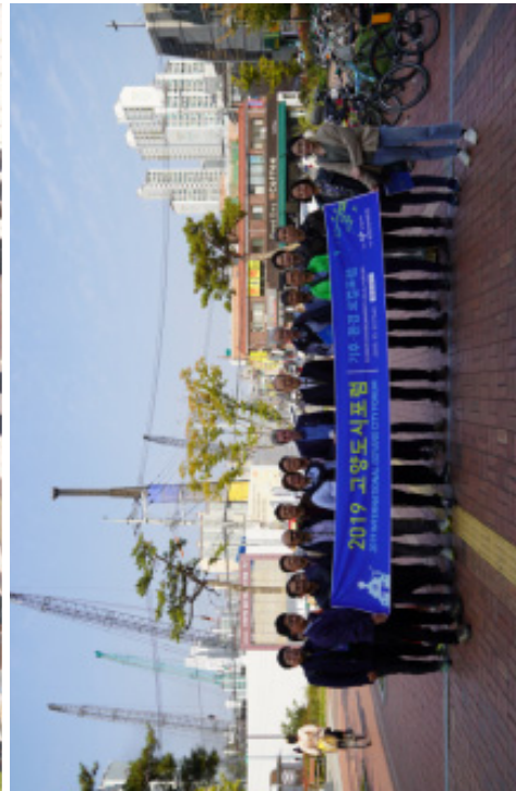
[그림 2-6] 일산역 일대 탐방 사진