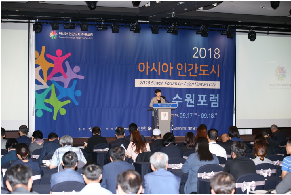
[그림 3-2] 아시아 인권도시 수원포럼 사례