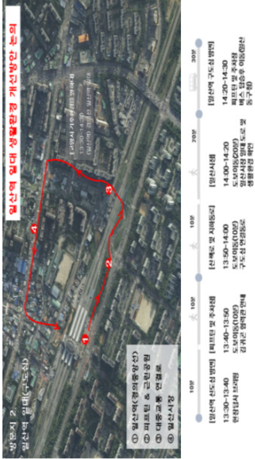
[그림 2-5] 임산역 일대 세부 탐방 일정