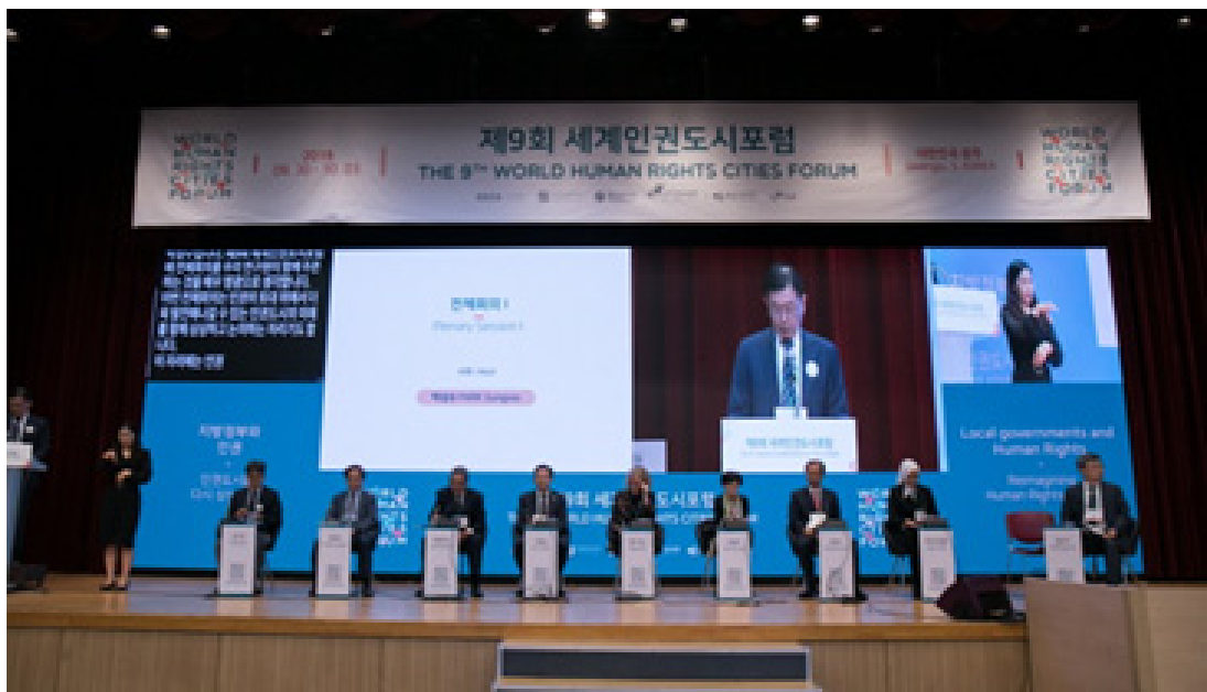
출처: 세계인권도시포럼 홈페이지 ( http://www.whrcf.org/ ) 접속일 2019.12.23.