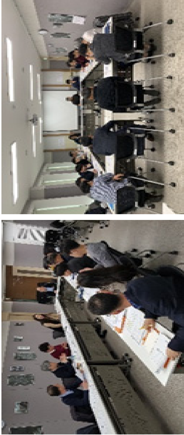
[그림 2-2] 2019년 고양 도시표현 준비회의