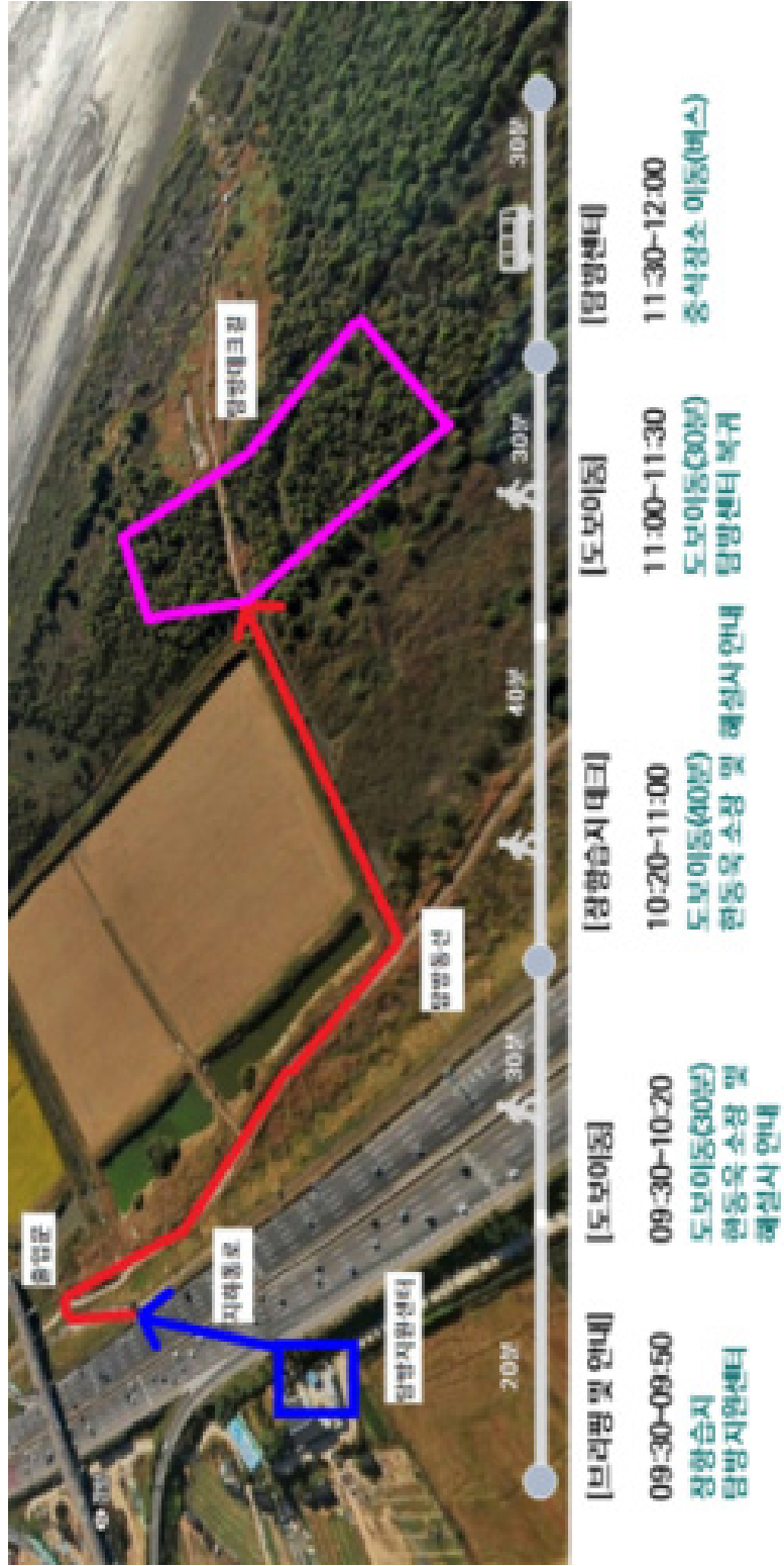
[그림 2-3] 정향습지 세부 탐방 일정